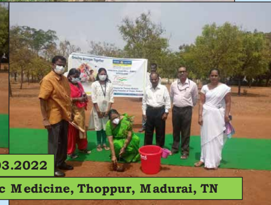
Govt Hospital for Thoracic Medicine, Thoppur, Madurai, TN