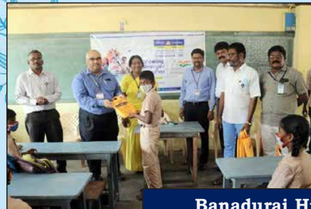
Banadurai Higher Secondary School, Kumbakonam, TN