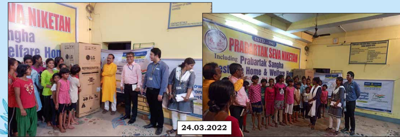
Zonal Office – Chinsurah, West Bengal donated Refrigerator and other items to Girls Orphanage Prabartak Seva Niketan established in 1943 in Chandan Nagar, West Bengal.