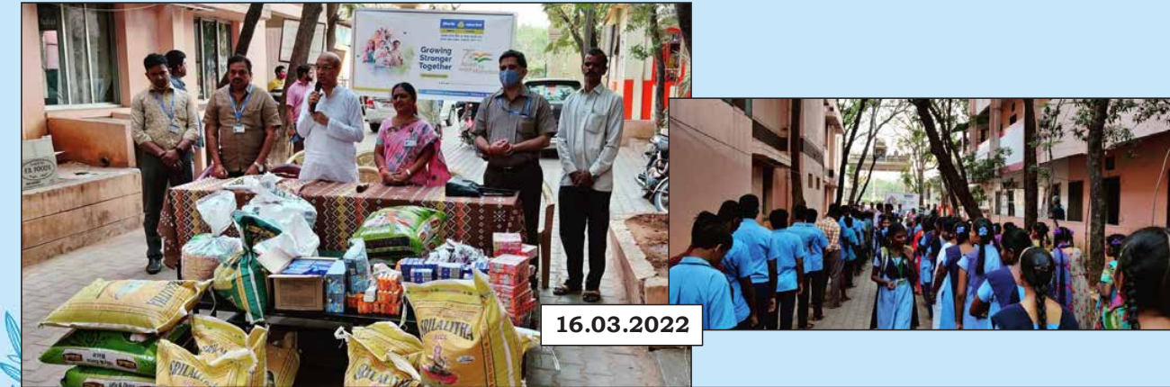
Zonal Manager (Tirupati) along with her staff, distributed Essential Provisions to NAVAZEEVAN Blind Relief Centre, Tirupati, Andhra Pradesh