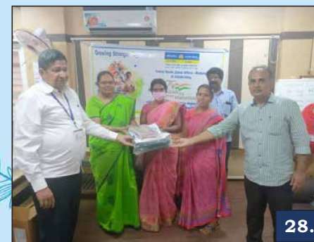
Avvai Corporation Higher Sec School, Madurai, TN