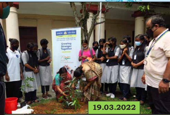
Government Higher Secondary School for Girls Ernakulam, Kerala