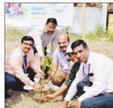
Officers of India Bank, Zonal Branch seen during plantation programme.