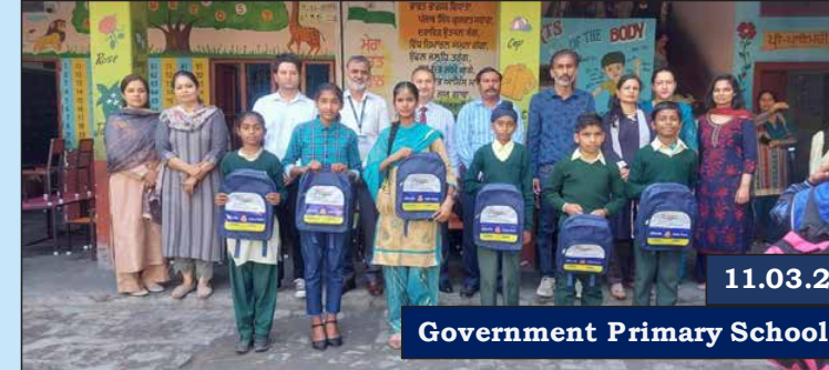
Government Primary School Dugari, Ludhiana, Punjab