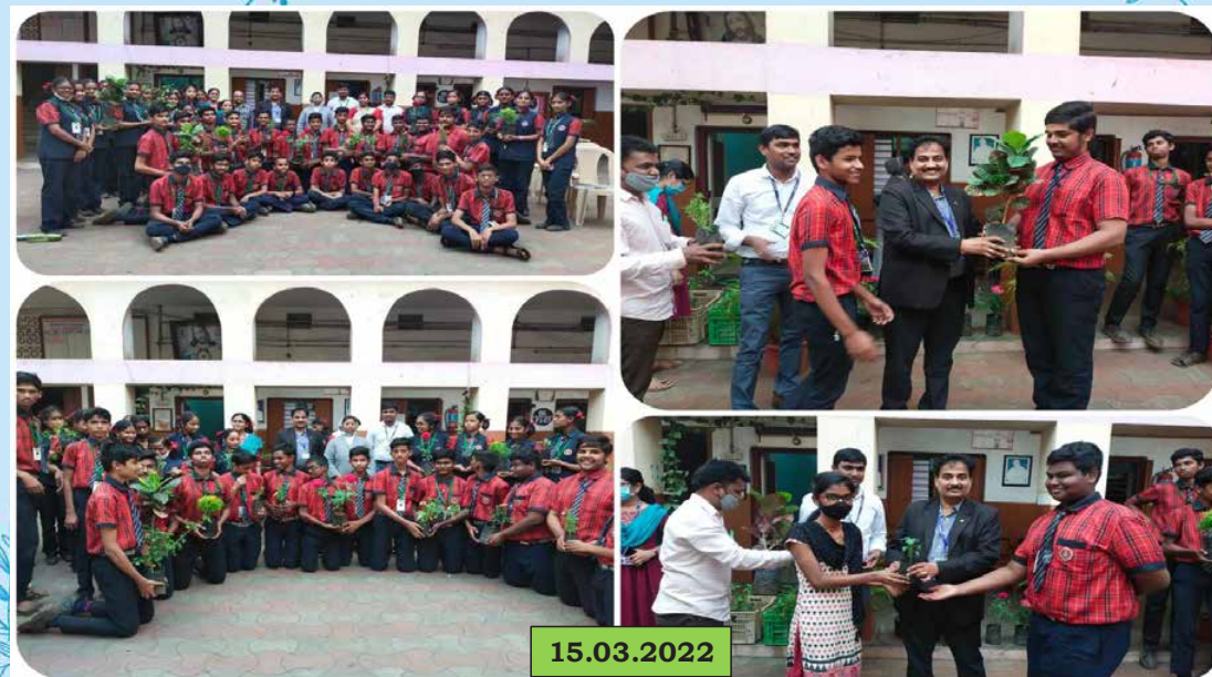
Distribution of Tree Saplings to the Teachers and students of Nirmala EM High School Vishakhapatnam, Andhra Pradesh by Zonal Manager (Vishakhapatnam) Andhra Pradesh