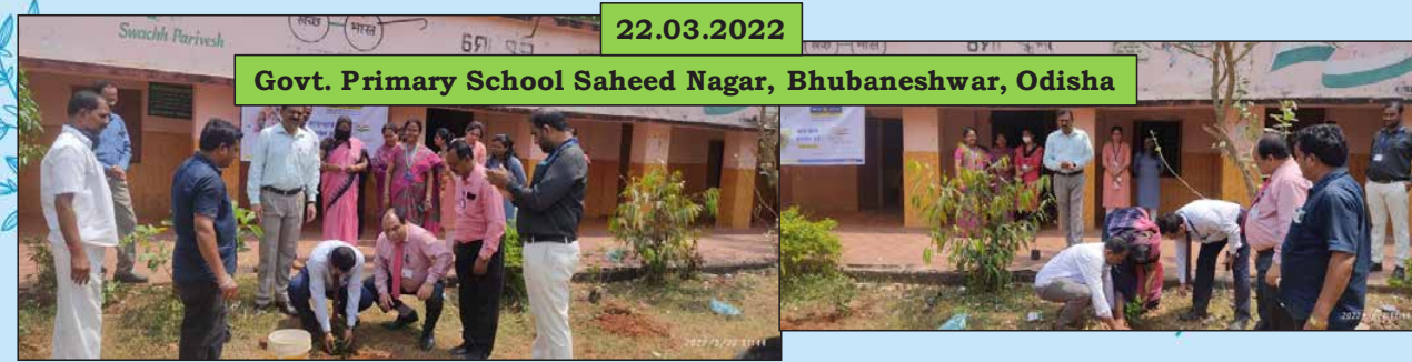
Govt. Primary School Saheed Nagar, Bhubaneswar, Odisha