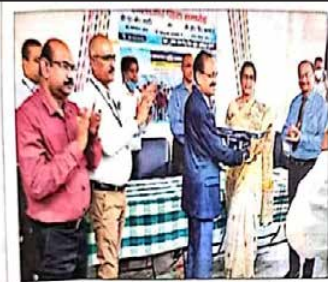
कमला नेहरू शिशु विहार पटनपुर में कॉपी व कलम वितरण करते अतिथिगण।