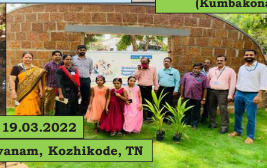
Tapovanam, Kozhikode, TN