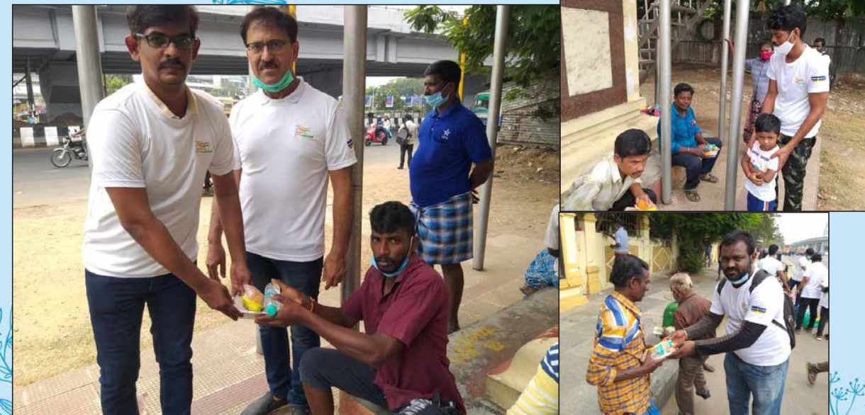
Distribution of food packets to the homeless people at Koyambedu Bus Stand by the staff of Indian Bank, Corporate Office on 23.03.2022.