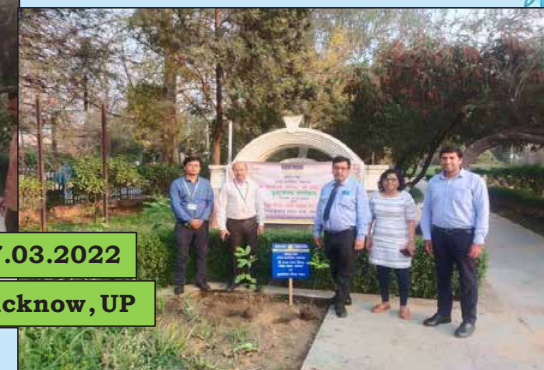
Begum Hazrat Mahal Park, Lucknow, UP