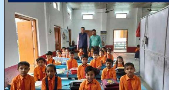
Ramkrishna Mission school, Dibrugarh Assam