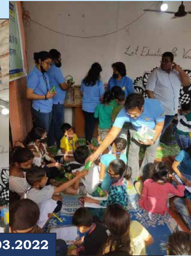
Pahchan-The Street School, Indraprastha, New Delhi