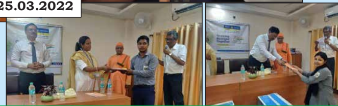
Zonal Manager (Asansol), West Bengal distributing Printers and other important items to Ramakrishna Mission, ITI College, Asansol