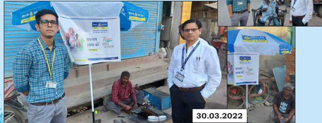
Zonal Office (Udaipur) distributed Azadi Ka Amrit Mahotsav branded umbrellas to the street vendors and the needy persons at Udaipur, Rajasthan