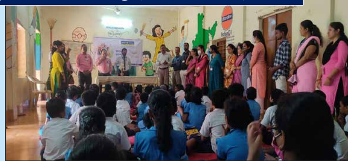
Govt. Primary School Saheed Nagar, Bhubaneshwar, Odisha