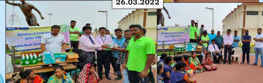
COVID Safety Kits distributed by Zonal Manager (Berhampur) Odisha with staff members of Indian Bank