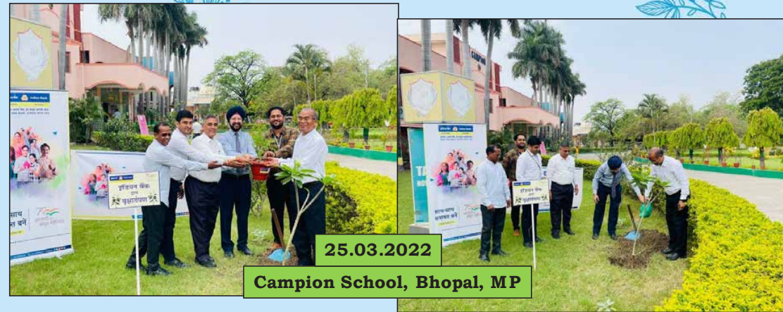
Campion School, Bhopal, MP