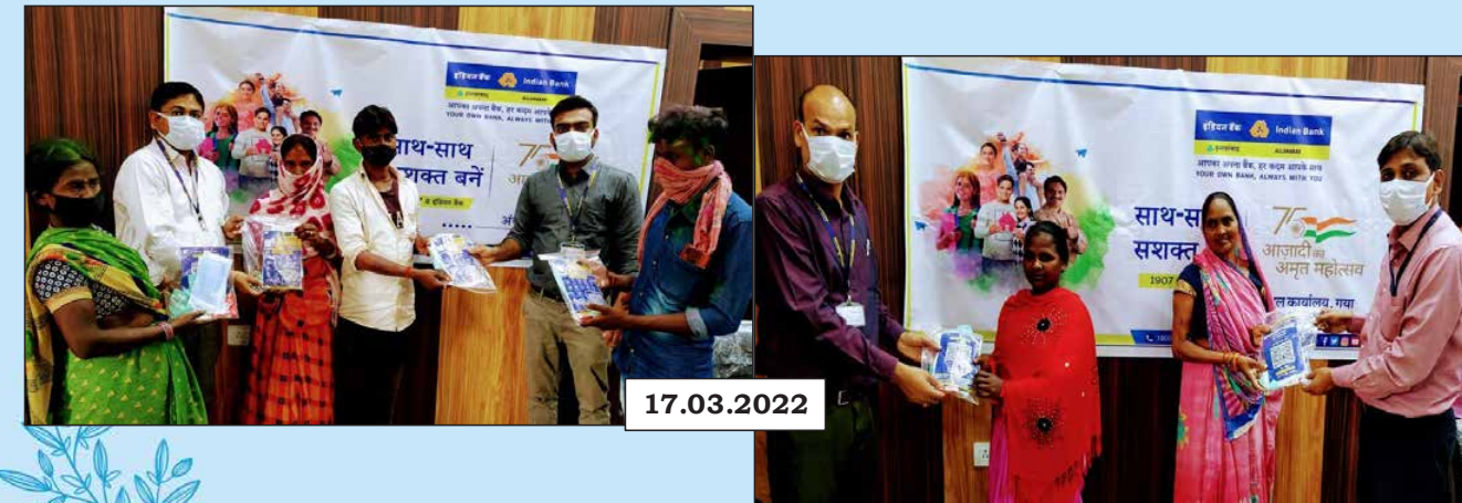
COVID Safety Kits were distributed by Deputy Zonal Manager and Staff of Zonal Office, Gaya, Bihar to the frontline workers of Gaya Municipal Corporation office.