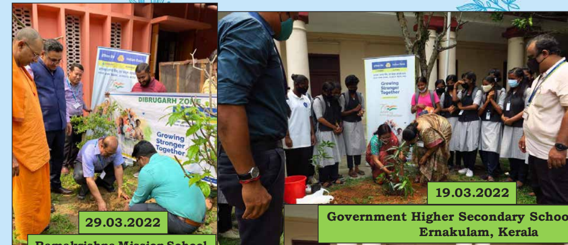
Ramakrishna Mission School Dibrugarh, Assam