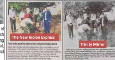
The New Indian Express