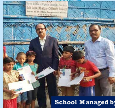
School Managed by NGO, SEED, Kolkata, West Bengal