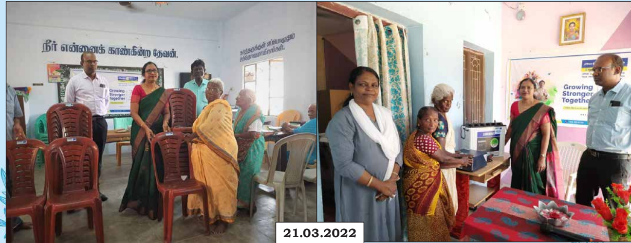
Zonal Manager and Deputy Zonal Manager, Tirunelveli handed over chairs to SHALOM OLD AGE HOME, Palayamkottai and Inverter and Battery to THOOIYAGAM OLD AGE HOME, Viravanallur, Tamilnadu