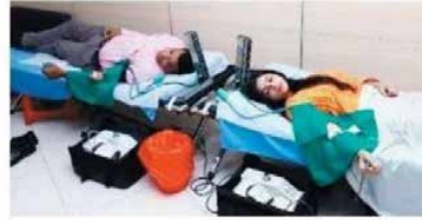
बैंक के आजादी का अमृत महोत्सव के सहयोग से 122 यूनिट रक्त का एक हिस्सा है। जहां वीएचएस एकत्रित किया गया।